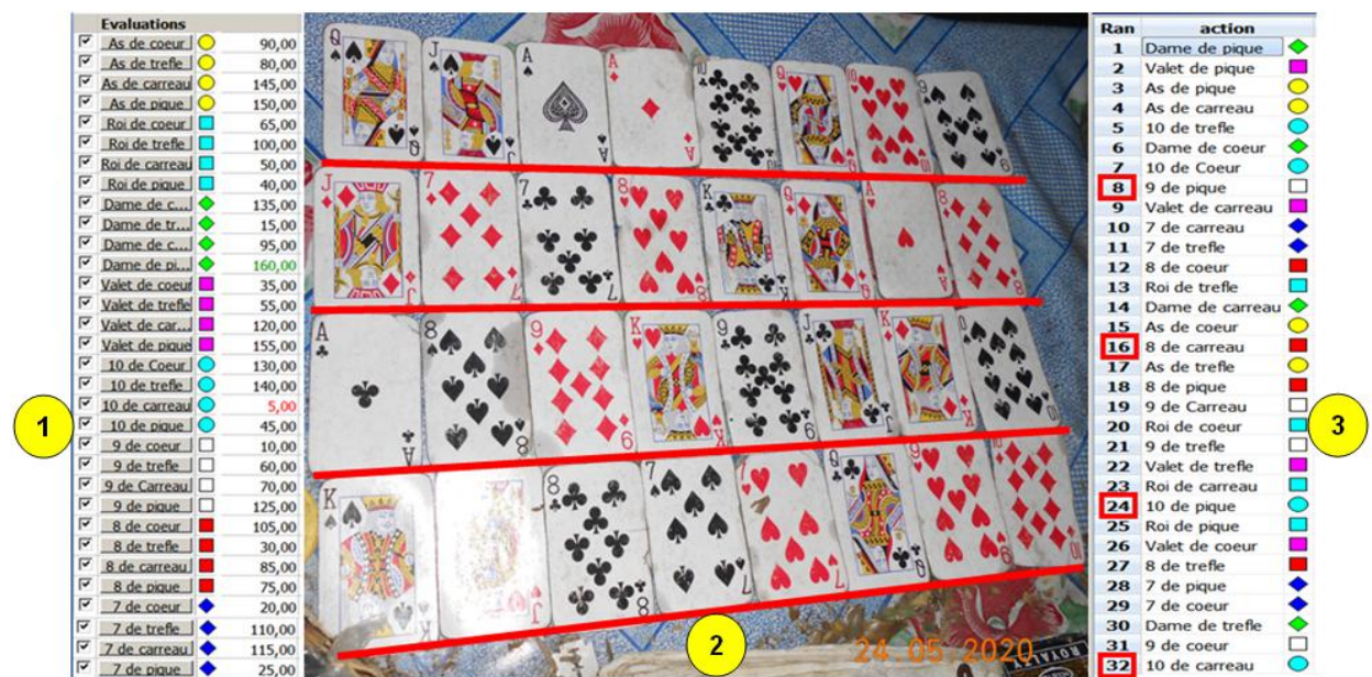
Figure 1 : Présentation générale du traitement de la consultation "Malheur"

lecture de cartes posées sur la natte tel que : la lecture en ligne de la gauche à la droite en comptant de 1 à 7, la lecture ascendante et descendante qui respecte l'ordre de comptage de 1 à 7, la lecture diagonale selon le sens de la lecture du haut en bas et vice-versa, dans ce cas l'ordre de comptage est de 1 à 4, et la lecture de carte 2 à 2 par colonne du haut en bas et vice-versa. La lecture de la carte est l'objet final de résultat de consultation avec la prescription du médicament correspondant. La figure 1 illustre le résultat réel de rangement effectué par la femme ombiasy et le résultat de traitement réalisé par la méthode PROMETHEE.