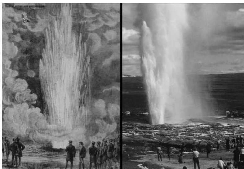
Figure 2 : Tourisme géothermique en Islande - Images spectaculaires d'un geyser il y a environ 150 ans (à gauche) et pendant les temps récents (à droite) (EnjoyIceland, 2012)

À part leur importance pour la récréation et le loisir, les attentes des visiteurs pour les sources chaudes à destination touristique incluent leurs environnements naturels et leurs paysages exceptionnels, il en est de même de l'importance de l'éducation dans des centres d'information ou centres interprétatifs, pour les visiteurs locaux, au sujet des phénomènes géologiques. Les différents types de sources chaudes (Figure 2) ont été en fait des attractions touristiques pendant plusieurs siècles et ceci est bien documenté dans la littérature (Hróarsson et Jónsson, 1992).