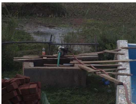
Figure 8: Source captée alimentant les nouvelles installations