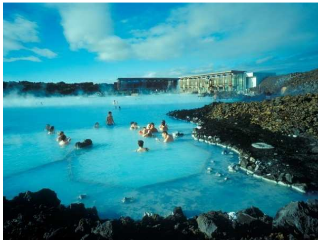
Figure 4: La fameuse Blue Lagoon, une piscine naturelle à vocation thérapeutique (EnjoyIceland, 2012)

En Islande où l'activité géothermique est presque partout "sous les pieds", les établissements et les opérateurs privés offrent aux touristes des visites de leurs "paysages" infernaux. A cause des traits et des structures géologiques du pays, en un peu de temps les paysages volcaniques et géothermiques, les geysers jaillissants et les étangs bouillants peuvent être explorés. En Islande on peut supposer sans risque que chaque visiteur participera tôt ou tard à quelque forme de tourisme géothermique, même si ils visitent seulement la célèbre Lagune Bleue (Figure 4). Dans le sud d'Islande, Landmannalaugur est l'un des sites géothermique de sources chaudes les plus populaires. Les gens s'y rassemblent à tout moment pour découvrir le paysage volcanique unique et se délasser (se relaxer) après une séance de pluie de sources chaudes en plein air. Comme dans quelques autres pays (Nouvelle Zélande, Indonésie, Australie, etc.) l'Islande offre aussi des visites dans des centrales électriques géothermiques qui sont pédagogiques et instructives.