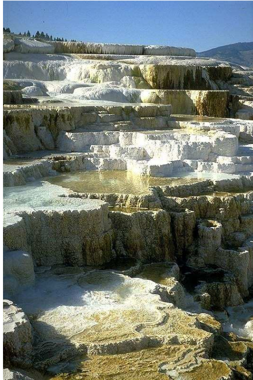
Figure 6: Le Mammoth Hot Springs dans le Yellowstone National Park

Il existe beaucoup d'autres régions géothermiques actives avec des sources chaudes extrêmes, geysers et lacs bouillants sur les deux continents américains. On peut aussi les trouver dans beaucoup de pays, le long de la "ceinture de Feu" comprenant l'Indonésie et les Philippines, ainsi que dans les géoparcs et parcs nationaux de la Chine.