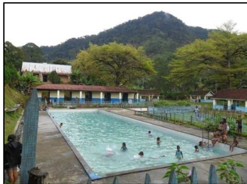
Figure 11 : Piscine thermale de Ranomafana