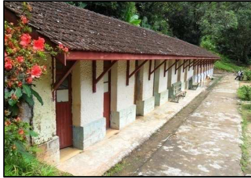
Figure 10 : Bâtiment pour bain thermal