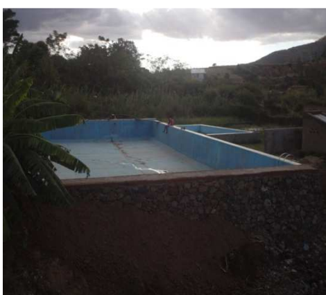
Figure 9: Piscine alimentée par captage de source thermique