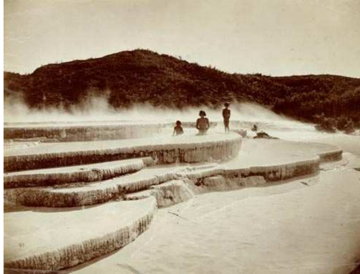
Figure 5: Touristes prenant un bain dans la fameuse Pink Terraces dans les années 1870

Les terrasses géothermiques avec leur beauté unique, à l'exemple de la Pink Terraces dans le Lac Rotomahana (Figure 5), ont attirés des visiteurs en Nouvelle Zélande depuis les derniers siècles.