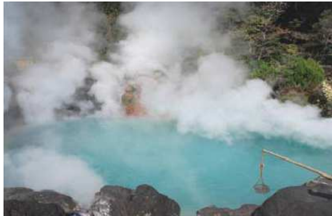
Figure 3: Cuisson d'œufs à la vapeur dans un étang bouillant (Japan National Tourism Organization, 2012)

(Figure 3) et c'est une expérience culinaire ne pas manquer. Le nombre de visiteurs annuel dans la ville de Beppu est de 12 million en moyenne, principalement des touristes autochtones.