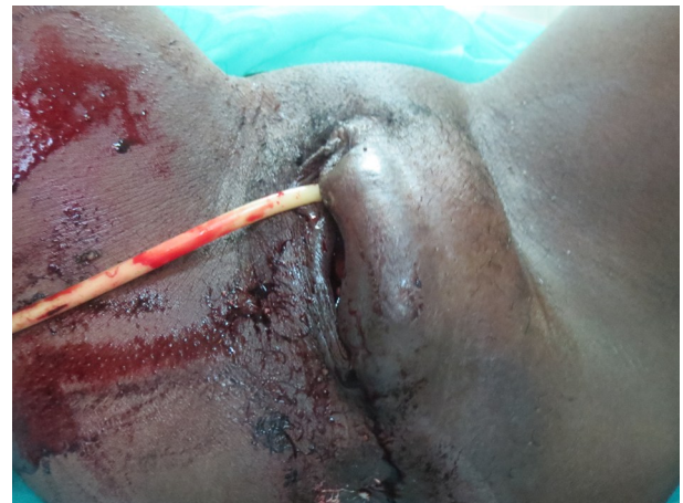
Figure 1: Asymétrie de la vulve vue de face Vulva asymetria (front view)

Il s'agit d'une femme âgée de 35 ans, G6P5, référée au CHU pour une tuméfaction pelvienne du postpartum immédiat avec une hémorragie génitale après accouchement à domicile réalisé par une tradipraticienne d'un bébé vivant et apparemment normal, pesant 3500g. A son arrivée à l'hôpital, elle présentait une hémorragie génitale modérée mais associée à une altération de l'état général importante. On notait une pâleur importante, une pression artérielle à 94/45mmHg et une fréquence cardiaque de 106/mn. A l'examen physique, on observait une asymétrie nette (fig 1) de la vulve avec tuméfaction importante du coté gauche. On observait lors de l'examen sous-valve une lésion traumatique du vagin, mesurant 5cm environ (fig 2). C'était une déchirure complète et hémorragique, à l'origine de l'hématome périnéo-vulvaire. Le saignement est a priori d'origine artérielle du fait de la rapidité de l'installation ainsi que son aspect rouge. Le globe utérin était bien formé, bien tonique. On n'avait pas son taux d'hémoglobine ni sa créatininémie à l'entrée. Une intervention sous anesthésie générale a été pratiquée au bloc opératoire. Plus de 500ml de caillot était extériorisé. On ne pouvait pas avoir la certitude quant au niveau supérieur de l'hématome mais la tuméfaction périnéale ne disparaissait pas après l'évacuation de l'hématome. Un drain a été mis en place et le vagin